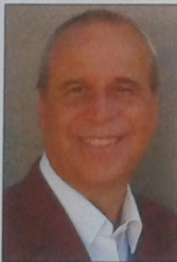
Por Fernando Solari*

Mientras algunas empresas siguen haciendo "filantropía tuneada", otras realmente incorporan la sustentabilidad a su proceso de negocios. Moda por hacer reportes y la necesidad de volver al foco.