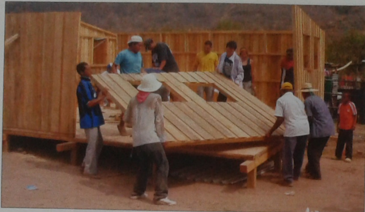
INNOVAR. Hay compañías que hacen voluntariado armando casas. Si existen recursos humanos para otra cosa, deberían ser aprovechados para lo que realmente crea valor.

imagino que habrás despedido a tu Director de RSE. "No, ¡si es uno de los mejores del mercado!"